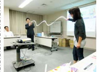
勉強会でエネルギーの体感