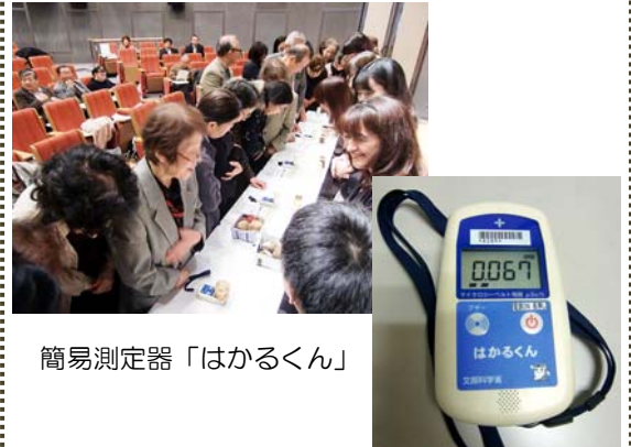
簡易測定器「はかるくん」

参加者による「はかるくん」体験 発芽を防止するため放射線を照射したじゃがいもと普通のじゃがいもなどの数値測定を体験しました。