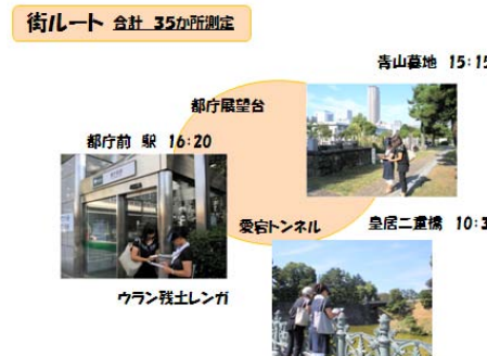
街ルート 合計 35か所測定