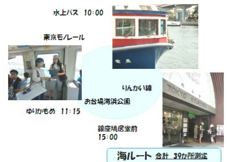
海ルート 合計 39か所測定