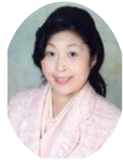
プロフィール 江上 佳奈美氏

作家・エッセイスト、評論家 東洋英和女学院高等部卒業。ニューヨークのサラ・ローレンス・カレッジで演劇を学ぶ。帰国後第一作の『親離れするとき読む本』は体験的家族論として注目されベストセラーとなる。執筆活動の他、テレビやラジオの出演や、講演、公的機関や民間団体の審議委員など精力的に活動。